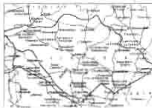
Las carreteras del estado de Tlaxcala

Salvo un área de 750 km 2 que drena al golfo, la mayor parte del estado de Tlaxcala, aproximadamente 3,051,370 km 2 del territorio del centro y del sur (incluye la región del Volcán La Malinche), está comprendida dentro de la región hidrográfica Rio