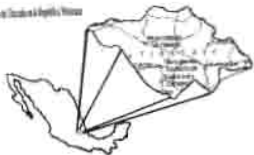
Ciudad de Puebla y región de Tlaxcala

de ellas hay un alto número que están asfaltadas. En la región del Volcán La Malinche esto mismo ocurre (Véase mapa no. 4). Asimismo, el Estado cuenta con vías de comunicación hacia el exterior por donde salen mercancías producidas en las industrias como textiles, acumuladores, pegamento, etcétera, y gente, o entran productos tecnológicos y de insumo de fábricas y de uso doméstico. La ciudad de Tlaxcala dista 316 km. al Puerto de Veracruz, 211 km. de Xalapa de Enríquez, 120 km. de la Ciudad de México y 32 km. de Puebla (COPLADET, 1993).